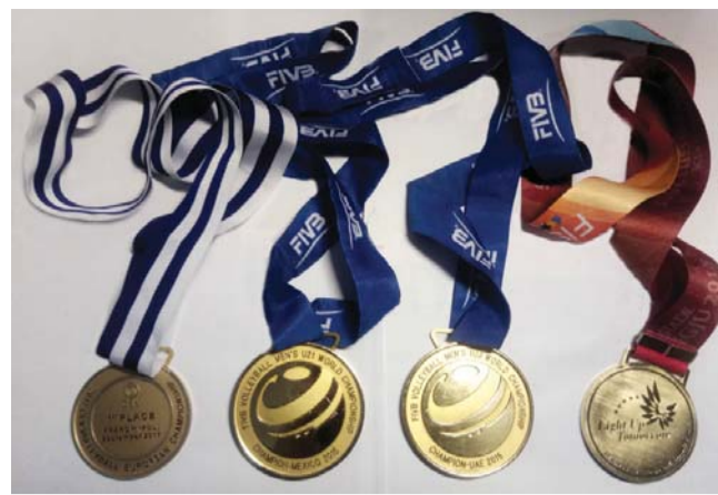
Чемпионские медали Дениса Попова